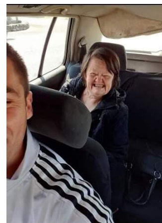
Prijevoz ciljanih korisnika

Kroz provedbu projekta naišli smo na odstupanja u Planu aktivnosti, kao treća aktivnost navedeno je Obilježavanje Međunarodnog dana za starije osobe koje se planiralo održati u Domu za starije osobe i rehabilitaciju Metković, zajedno sa svim korisnicima partnerskih organizacija. Nažalost s obzirom da je Dom zatvoren za javnost sukladno mjerama stožera za civilnu zaštitu nismo bili u mogućnosti