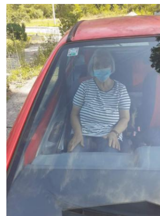
Prijevoz ciljanih korisnika