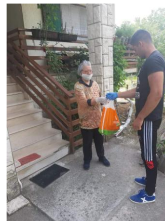
Dostava namirnica i lijekova ciljanim korisnicima tijekom lockdown-a